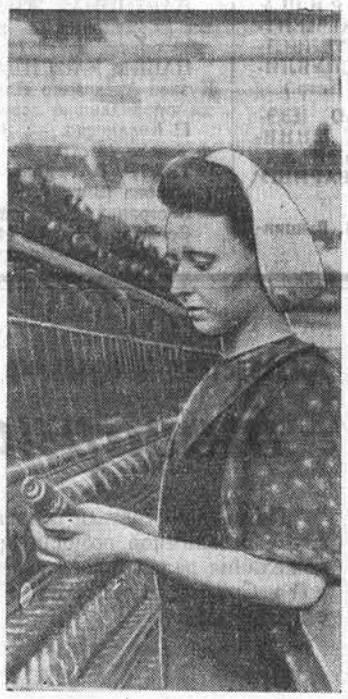
На Барнаульском меланжевом комбинате широко развернуто соревнование в честь выборов в местные Советы. Текстильщики дали слово досрочно выполнить двухмесячную программу.