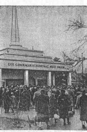
Весь немецкий народ высказывает непоколебимую решимость бороться за мир, за объединение Германии и протестует против заключения кликой Аленгаура сепаратных военных договоров.

КАИР, 12 февраля. (ТАСС). Как сообщает египетское агентство Мена, 9 февраля вблизи Каира разбился египетский военный самолет. 30 человек убито и пять ранено.