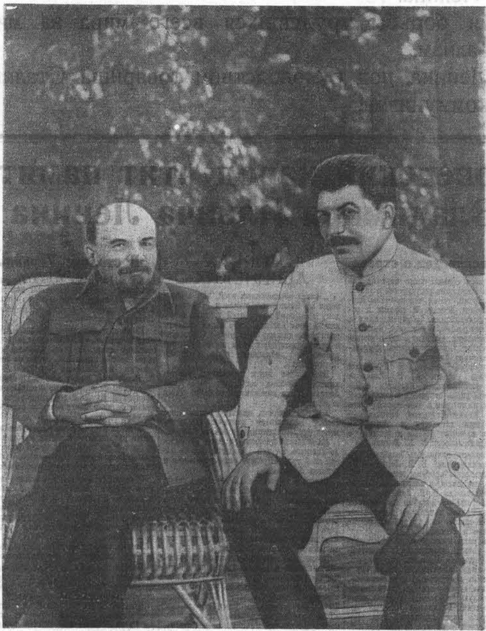
В. И. ЛЕНИН и И. В. СТАЛИН в Горках в 1922 году.