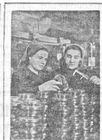
Станционеры московского завода «Красный пролетарий» новыми трудовыми подвигами отмечают наступление XIX съезда партии.

В довоенное время тепловые электростанции СССР работали в основном на паре давлением до 35 атмосфер. Переход на агрегаты высокого давления дает свыше 300 тысяч тонн экономии высококачественного угля в год на каждый миллион киловатт мощности.