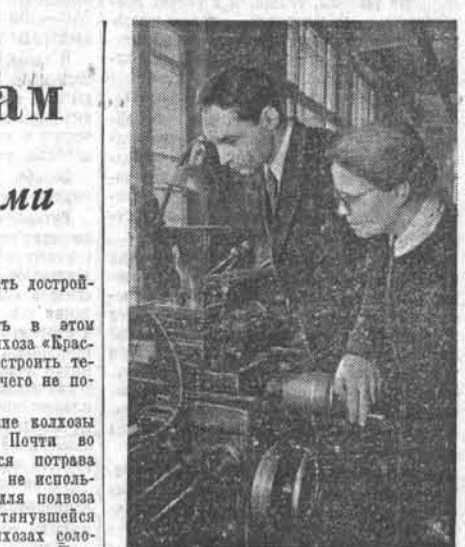
Москва. Всесоюзный научно-исследовательский инструментальный институт разработал ряд новых конструкций резов с механическим креплением...

Онгуае недооценивают идеологическую работу (2 стр.) БОЛЬШЕ ЛЕСА РОДИНЕ! П. Кривенко. — Годовой план лесозаготовок будет выполнен досрочно (2 стр.) В ПОМОЩЬ ПРОПАГАНДИСТУ. В. Доброезерова. — О формах и методах работы в кружках повышеного типа (2 и 3 стр.) И. Ашихин. — Неуклонно повышать культуру земледелия в Кулунде (3 стр.) НОВОЕ В СЕЛЬСКОХОЗЯЙСТВЕННОЙ ПРАКТИКЕ. П. Куфель. — Приспособление для очистки овса от овсюга (3 стр.)