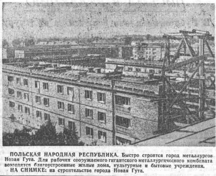
ПОЛЬСКАЯ НАРОДНАЯ РЕСПУБЛИКА. Быстро строится город металлургов Новая Гута. Для рабочих сооружаются гигантские металлургического комбината возводятся благоустроенные жилые дома, культурные и бытовые учреждения. НА СНИМКЕ: на строительстве города Новая Гута.