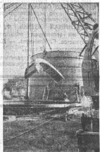
На Каховском гидроузле идет подготовка к укладке бетона в основные гидротехнические сооружения. На строительных площадках возводятся автоматизированные бетонные заводы. НА СНИМКЕ: на строительстве центрального автоматизированного бетонного завода.

Ф. СИТНИКОВ, секретарь партбюро Бийского зерносовхоза.