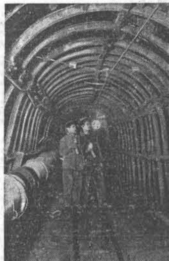
РОСТОВСКАЯ ОБЛАСТЬ. В шпеклах шахт комбината «Ростовуголь» внедряется металлокрепление. Новый способ крепления даст возможность улучшить состояние горных выработок, сократить расход крепящего леса. НА СНИМКЕ: основной шпекл шахты № 46 треста «Шахтантрацит», закреплённый арочным металлокреплением.

Выясняется, что ему никто даже не говорил об узловом методе ремонта. Не определены и сроки окончания работы.