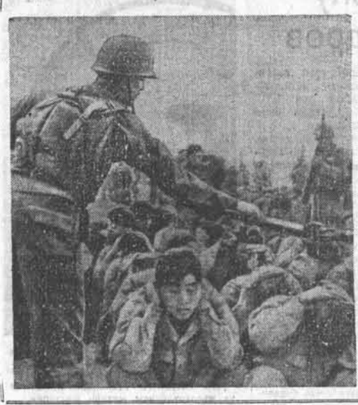
Этот снимок сделан американцами в лагере корейских и китайских военнопленных на острове Кочедо и разослан агентством Юнайтед Пресс с подписью: «Урок дисциплины». Вот так, ударяя ружейных прикладов, американские варвары хотят покорить свободолюбивые народы. Но борьба в Корею продолжается, продолжается не только на поле боя, но и в лагере военнопленных. Снимок из итальянского журнала «Виве нуэво».