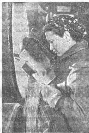
Многие рабочие Бийского котельного завода настойчиво борются за досрочное выполнение годовых производственных норм.