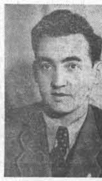
Гроссмейстер А. Котов.