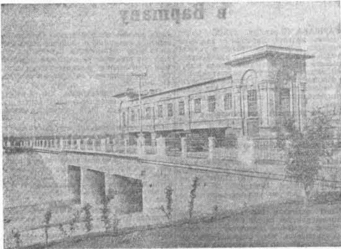
Старополевский край. Ширится фронт работ на строительстве Кубань-Егорлыкской оросительной системы. НА СНИМКЕ: вид на шаху.