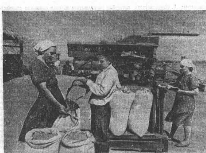
Колхозники сельхозартеля имени Куйбышева, Рубцовского района, стремясь встретить XIX съезд партии производственными достижениями, усиленно работают на полях. НА СНИМКЕ: подготовка хлеба на току для сдачи государству.

Докладчик обращает внимание на то, что в ряде неудовлетворительно выполняются постановления правительства Российской Федерации о мерах по улучшению работы школ. Установленный правительством план развертывания сети школ и роста контингента учащихся в крае не выполняется на протяжении многих лет. В прошлом учебном году, например, в 5—7 классах обучалось лишь 73,5 процента детей школьного возраста. 1254 учащихся не были охвачены обучением из-за отдаленности места их жительства от школ. Неудовлетворительно выполняется закон о всеобщем обязательном семилетнем обуче-