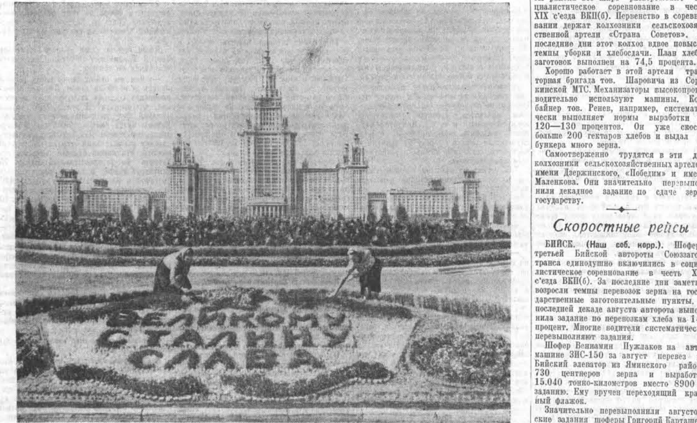
МОСКВА. У высотного здания Московского государственного университета на Ленинских горах.