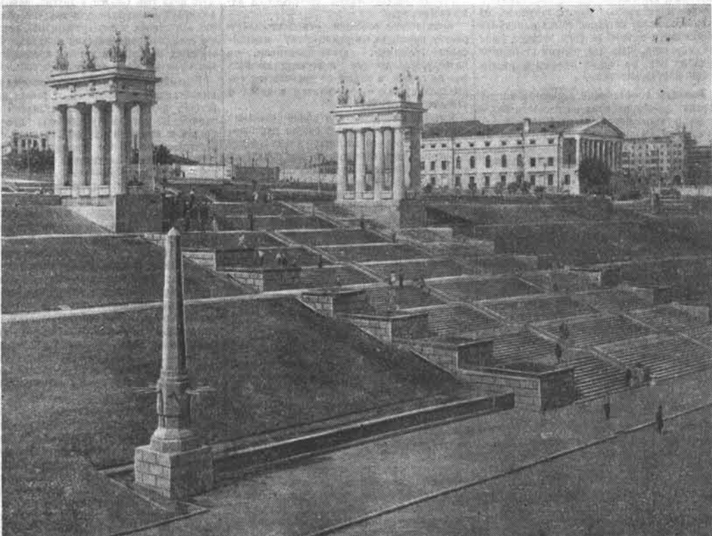
Сталинград. К открытию Волго-Донского судоходного канала имени В. И. Ленина в городе-герое была построена монументальная гранитная лестница — спуск к Волге. НА СНИМКЕ: вид на гранитную лестницу.

Кооперативные лавки на дому Правление Центросоюза обсудило вопрос об улучшении работы лавок на дому, которые обслуживают сельское население глубинных пунктов, где нет постоянно действующих торговых предприятий потребительской кооперации. Для кооперативных лавок на дому установлен примерный ассортимент товаров. Они будут постоянно иметь в продаже соль, спички, мыло, табачные и другие изделия, парфюмерию, письменные принадлежности, ряд хозяйственных и других товаров. Правлениям организаций потребительской кооперации предложено уделять больше внимания лавкам на дому, осуществлять строгий контроль за их работой. (ТАСС).