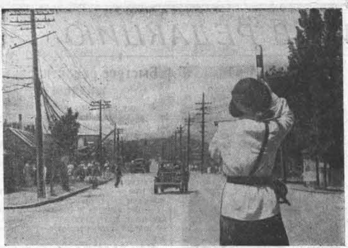
Корейская Народно-Демократическая Республика. На одной из улиц Пхеньяна.

ТЕГЕРАН, 7 августа. (ТАСС). Вместо уехавшего за границу и отказавшегося от поста председателя меджлиса Хасана Имиани сегодня подавляющим большинством голосов председателем меджлиса избран Кашани.