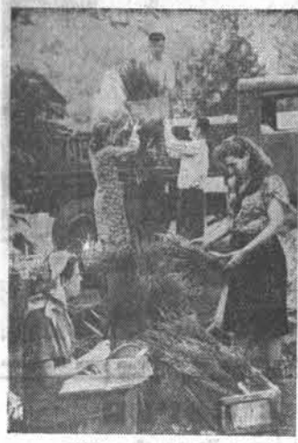
14 тысяч черенков яблонь посылает нынче питомник края Горно-Алтайский опорный пункт плодово-ягодной опытной станции.

Вот почему все силы и средства мы сосредоточили на заготовке кормов и на строительстве животноводческих помещений.