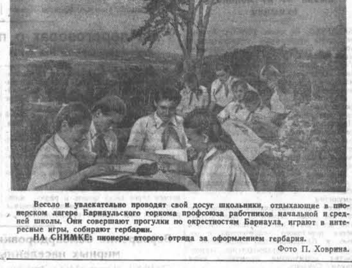
Весело и увлекательно проводят свой досуг школьники, отдыхающие в пионерском лагере Барнаульского горкома профсоюза работников начальной и средней школы. Они сохранили прогулки по окрестностям Барнаула, играют в интересные игры, собирают гербарии. НА СНИМКЕ: пионеры второго отряда за оформлением гербария.