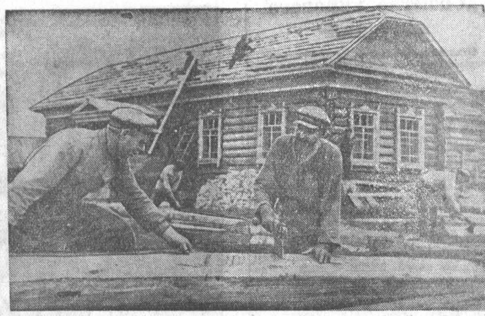
Большое строительство ведется в этом году в колхозе имени Молотова, Сростинского района. Здесь будут сооружены зернохранилище, ремонтно-механические мастерские, скотный двор, 10 жилых домов, кирпичный завод, установлена плурама. Сейчас колхозные плотники заканчивают строительство колхозного клуба.