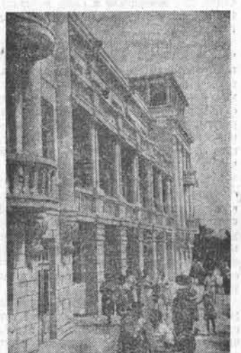
Ростовская область. В Мелеховском доме отдыха, расположенном на берегу р. Дона, проводится отпуск сотен горняков и членов их семей. НА СНИМКЕ: у главного корпуса дома отдыха.