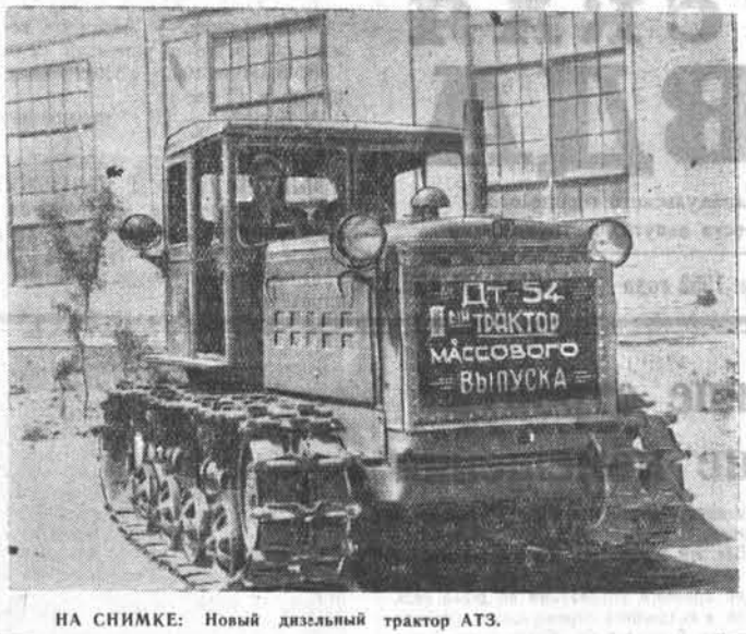
НА СНИМКЕ: Новый дизельный трактор АТЗ.

Вот почему так важно отметить успехи коллектива заготовительного и вентиляционного цехов. Оба они первыми выполнили задания, установленные на полугодие. Заготовительный цех завоевал звание цеха коллективного стахановского труда, вентиляционный признан первым местом и вручено заводское переходящее красное знамя.