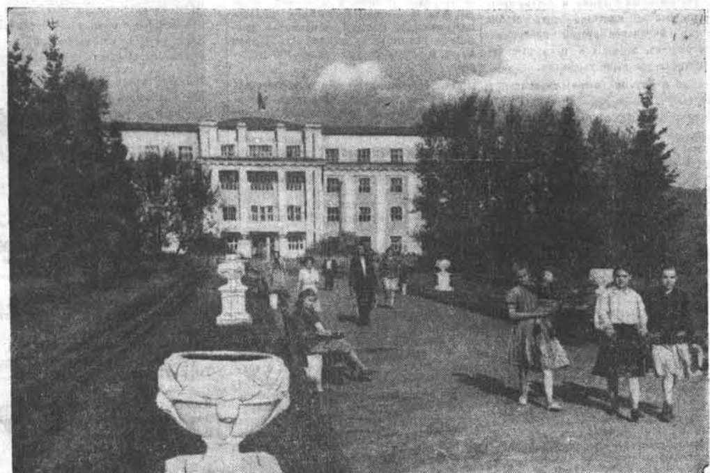
НА СНИМКЕ: Дом Советов в гор. Горно-Алтайске.

В. Морев. — Международный обзор (4 стр.). События в Корее (4 стр.). Заседание Римского комитета защиты мира (4 стр.). Посмертное награждение К. Э. Циолковского французским обществом авиации (4 стр.). Свободу Жаку Дюкло! (4 стр.). Забастовка в металлургической промышленности США (4 стр.). Ассигнования на расширение американских военных баз (4 стр.).