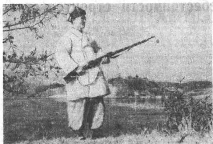
Все население Корейской Народно-Демократической Республики принимает активное участие в борьбе против американских захватчиков и их лживых агентов. Сейчас, когда аггрессоры ведут бактериологическую войну, жители городов и деревень бдительны следят за американскими самолетами, сбрасывающими бактериологические бомбы, и немедленно принимают меры по уничтожению зараженных насекомых и предметов.

БЕИРУТ, 9 июня. (ТАСС). Дамасское радио передало декрет о формировании нового сирийского правительства. В состав правительства вошли: премьер-министр, министр национальной обороны и министр внутренних дел — генерал Фези Село (однопартийно он же является главой государства); министр иностранных дел — Зафер Рафан; министр финансов — Саид Зам и др.