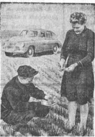
Быстро и с высоким качеством проводят все колхозники сельхозработы имени Ленина, Рубиновского района.