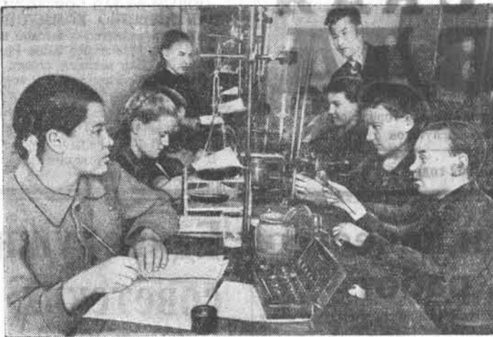
Упорно готовятся к предстоящим экзаменам учащиеся Ключевской средней школы. НА СНИМКЕ: ученики 7 класса за лабораторными работами по химии.