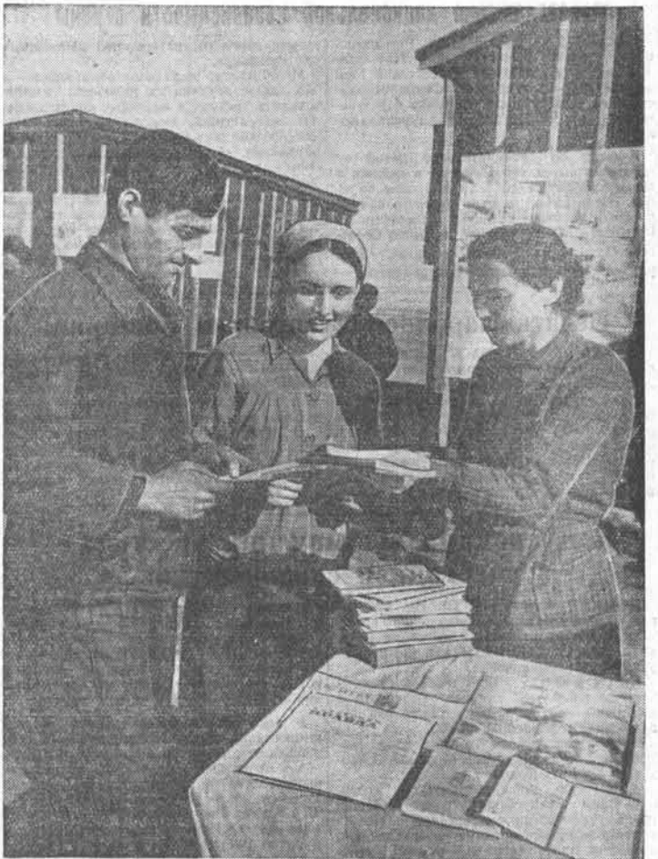
Работники Рубцовской районной библиотеки сложившиеся и передали в сельхозучастки и тракторные бригады 8 переданных библиотечек, активно участвуют в проведении массово-политической работы среди колхозников.

Естественное течение межвидовой борьбы на протяжении 10—12 лет требует сокращения его во времени вмешательством человека — правильным размещением посадочных мест шелюги, применением разработанных норм и способов посева сосны, а также регулярным стелением остатков пологом шелюги.