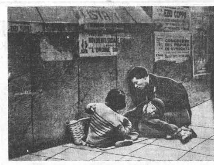
В Италии четыре миллиона безработных. Многие из них вынуждены нищенствовать. НА СНИМКЕ: типичная сценка на улице Неаполя.