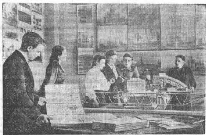
В барнаульском клубе «Строитель» на снимке: молодые строители осматривают в комнате техники модели строительных механизмов.