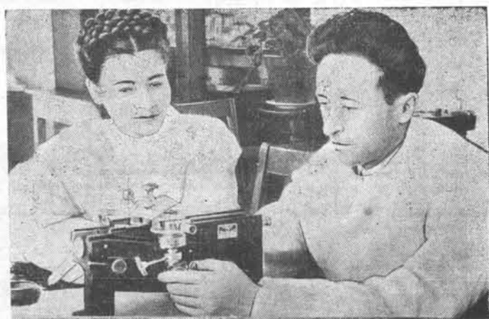
Недавно в г. Сталинске (Кемеровская область) организован институт усовершенствования врачей. В нем обучаются медицинские работники всей Сибири.

БЕРЛИН, 20 апреля. (ТАСС). Агентство АН сообщает из Мангейма: Два американских солдата вечером 17 апреля в Мангейме взяли такси и сказали шоферу, чтобы он вез их в бывшую казарму служивших зенитной артиллерии.