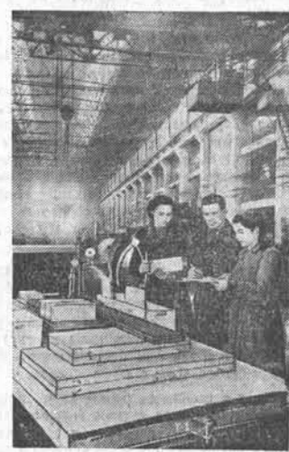
СВЕРДЛОВСК. Кладовщики Урало-Свердловского турбомоторного завода предлажили начать социалистическое соревнование за комплексное снабжение рабочих мест инструментом, приспособлениями и материалами.

Принято на собраниях рабочих, работниц, инженерно-технических работников и служащих фабрик и на областном собрании работников текстильной промышленности Ивановской области.