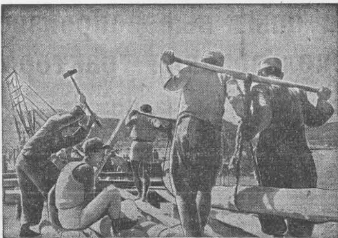
Корейская Народно-Демократическая Республика. Крестьяне восстанавливают мост, разрушенный американской авиацией.

Париж, 31 марта. (ТАСС). Как передает агентство Франс Пресс, всеобщий союз тунисских трудящихся «в знак протеста против арестов, произведенных в течение последних дней», объявляет в 1 апреля всеобщую забастовку. Всеобщий союз тунисских трудящихся призывает «все профсоюзные организации и всех трудящихся, служащих, железнодорожников, сельскохозяйственных рабочих принять участие в этой забастовке с верой и решимостью».