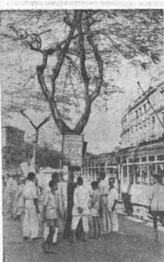
Недавно в Инди закончилась выборная кампания в центральном парламенте и законодательном собрании штатов.

Заявление г. Ачесона свидетельствует о том, что он не может скрыть своего беспокойства по поводу того значения, которое будет иметь Международное экономическое совещание, поскольку оно, несомненно, может оказать положительное влияние на развитие и укрепление международных связей, нарушенных в настоящее время, и на расширение международной торговли.