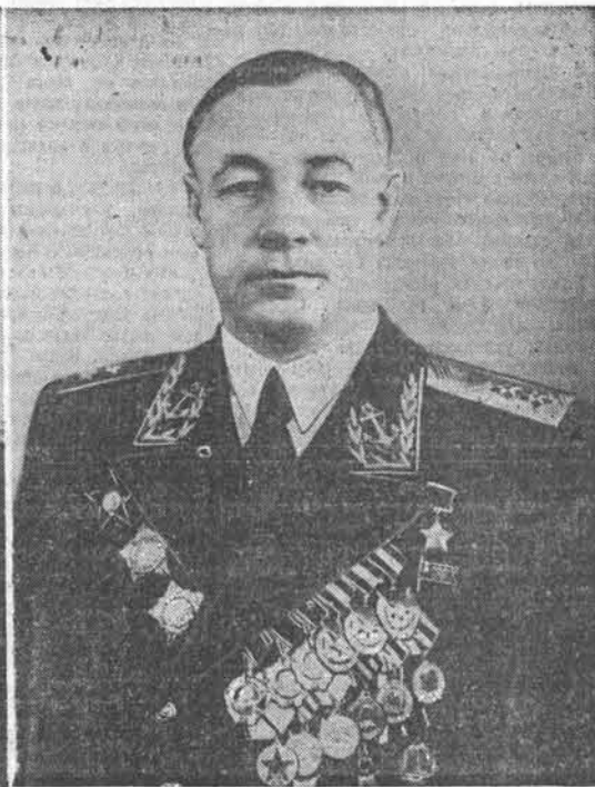
Военный Министр Союза ССР Маршал Советского Союза А. М. ВАСИЛЕВСКИЙ.