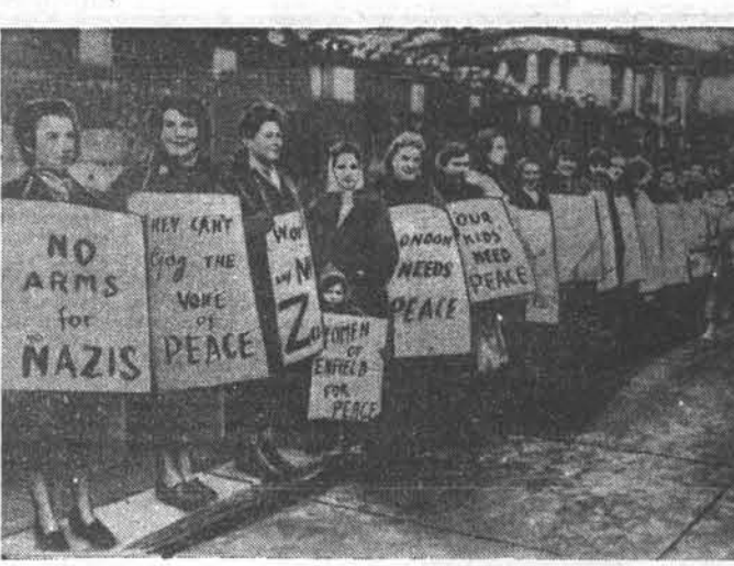
Английский народ протестует против того, что правительство Англии по требованию американских империалистов содействует возрождению немецкого милитаризма.

«Наш проект относительно принципов разрешения вопросов пункта 5-го повестки дня сам по себе ясен и не оставляет места для неправильных толкований. Термин «заинтересованные правительства» каждой из сторон в этом проекте означает, разумность, правительства заинтересованных стран со стороны корейской Народной армии и китайских народных добровольцев и правительств заинтересованных стран со стороны командования Объединенных Наций».