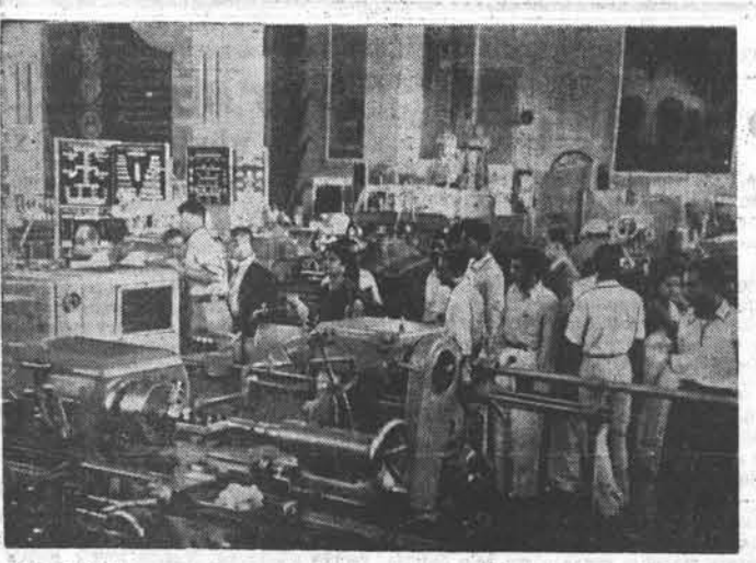
ИНДИЯ. Международная промышленная выставка в Бомбее. НА СНИМКЕ: в одном из залов советского павильона.

ТИПОГРАФИИ АЛТАЙСКОГО ТРАКТОРНОГО ЗАВОДА ИМЕНИ М. И. КАЛИНИНА — квалифицированный инструктор листодел, печатник на плоских машинах, стереотипер. Обратиться: Алтайский край, г. Рубцовск, Восточный поселок. Телефон — через коммутатор АТЗ № 0-81.