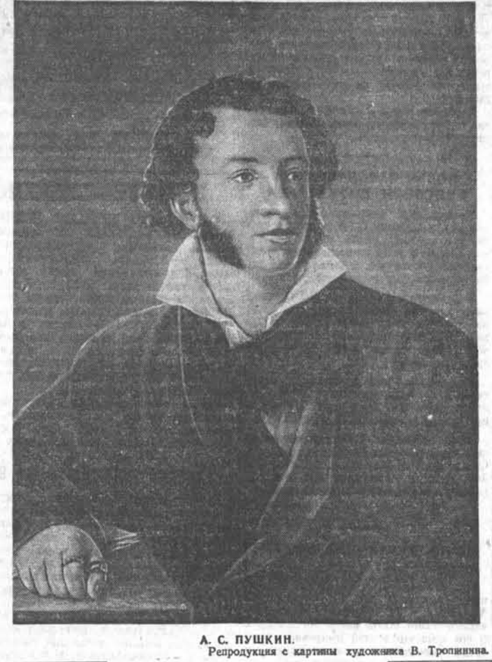
А. С. ПУШКИН. Репродукция с картины художника В. Тропинкина.

Сегодня исполняется 115 лет со дня трагической гибели гениального русского поэта Александра Сергеевича Пушкина. Народ Советского Союза высоко чтит его память. За годы советской власти творения Пушкина стали достоянием миллионов трудящихся нашей страны.