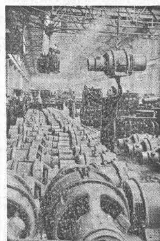
Армянская ССР. Ереванский электромашинностроительный завод успешно выполняет заказом предприятий, изготовляющих механизмы для великих строек коммунизма на Волге, Дону, Днепре и Амударье. На снимке: готовая продукция, предназначенная для отправки. Фото П. Лисенкина. (Фотохроника ТАСС).

Подсчитав свои возможности, берем на себя следующие обязательства: 1. В 1952 году получить урожай сахарной свеклы в колхозе