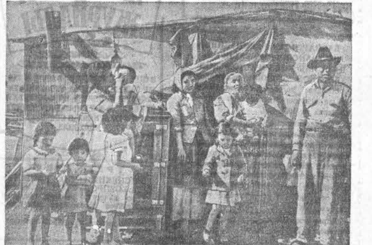
На этом фото изображена лачуга из брезента, дерюги и картона, в которой ютится американская семья из 11 человек.

Видимый контраст составляет жизнь этого дома с жизнью любого из домов в любом советском городе. Вот один из обычных домов Октябрьского района города Барнаула. Он расположен по Ленинскому проспекту, № 225.