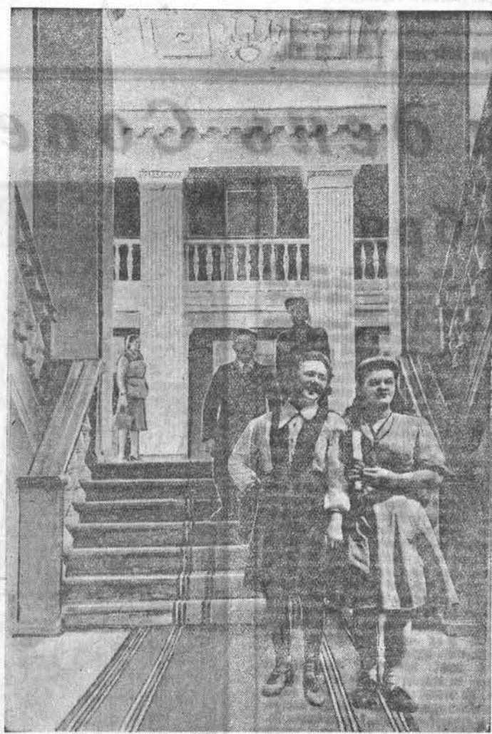
Вчера вечером в Барнауле состоялось открытие нового клуба строителей ордена Ленина треста «Стройгаз». На торжественном вечере, посвященном 34-й годовщине Октября, собрались передовые строители.

Много объектов сделано вчера к празднику коллективом второго строительного участка.