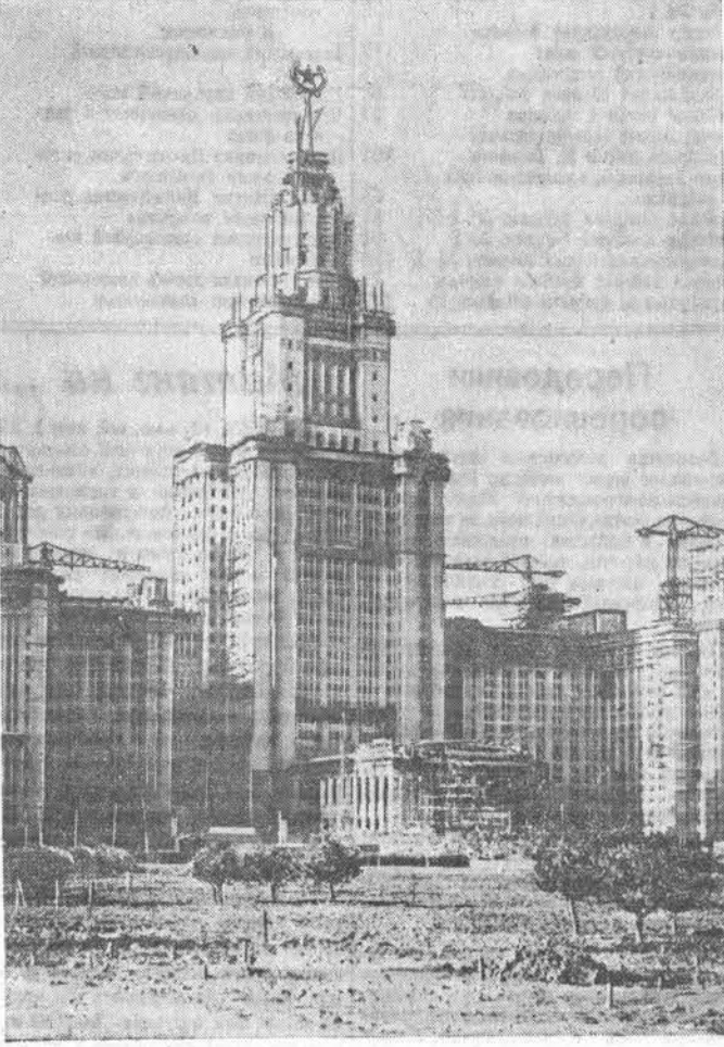
Москва. Строительство высотного здания Московского государственного университета на Ленинских горах.