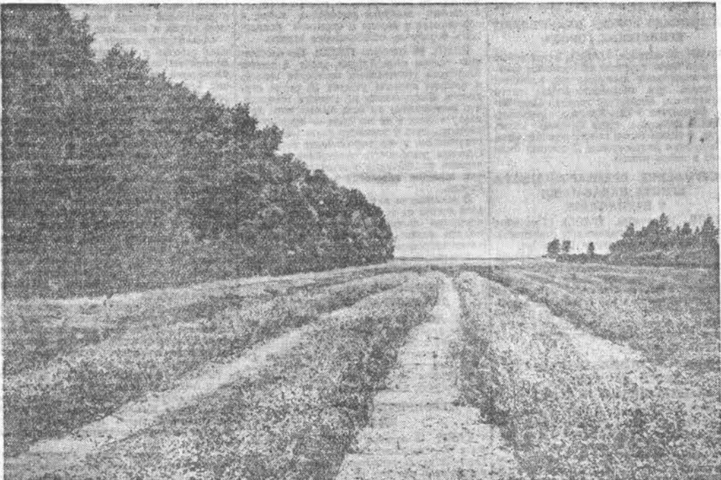
Колхозники сельхозартель имени Ленина, Рубовского района, уделяют большое внимание лесоразведению. Большинство полей здесь защищено от южных казахстанских ветров надежными лесными полосами. НА СНИМКЕ: лесная полоса, защищающая плодово-ягодный сад колхоза имени Ленина.

Неутомимый труженик продолжает работать на благо любимой Родины. Л. ГРИБАНОВ, кандидат сельскохозяйственных наук.