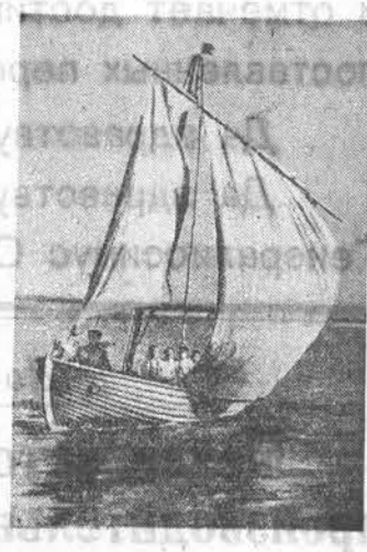
НА СНИМКЕ: занятия членов первичной организации ДОСФЛОТ 2-й Барнаульского неполной средней школы на морской шлюпке под парусом.