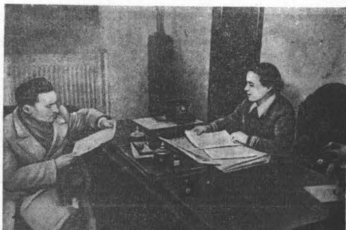
В Румынской народной республике женщины выдвигаются на руководящую работу. Они активно участвуют в политической и культурной жизни страны. Многие работники и крестьяне теперь занимают ответственные посты в государственном аппарате и в общественных организациях.