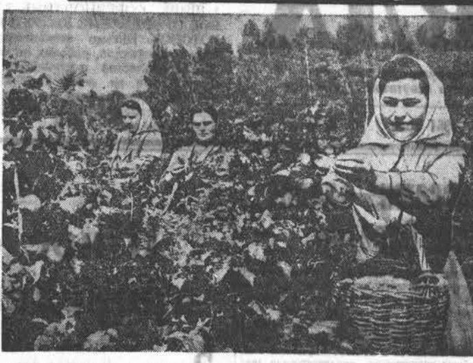
Много хлопьев вырасти выне работники пригородного совхоза № 2, Барнаульского сельского района. НА СНИМКЕ: работница хозяйства за сбором малины...