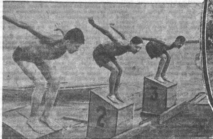
Физкультурники Барнаула готовят отметить свой традиционный праздник. НА СНИМКАХ: слева — молодые физкультурники на Барнаульской водной станции готовятся к сдаче норм ГТО по плаванию. В середине — члены велосипедной секции спортобщества «Медик» на тренировке. Справа — физкультурники легкоатлетической секции спортобщества «Спартак» на тренировке к кроссу.

Г. ГАЛЯНТИЧ, пред. цехкома швейфабрики № 7, в. БАРНАУЛ.