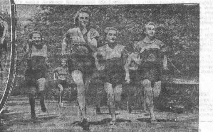
Физкультурники Барнаула готовят отметить свой традиционный праздник. НА СНИМКАХ: слева — молодые физкультурники на Барнаульской водной станции готовятся к сдаче норм ГТО по плаванию. В середине — члены велосипедной секции спортобщества «Медик» на тренировке. Справа — физкультурники легкоатлетической секции спортобщества «Спартак» на тренировке к кроссу.