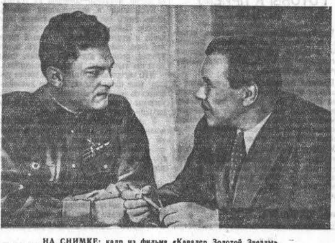
НА СНИМКЕ: кадр из фильма «Кавалер Золотой Звезды».

Отечественную войну уходит на фронт, становится командиром танка. За боевой подвиг под Сталинградом ему присваивается звание Героя Советского Союза.