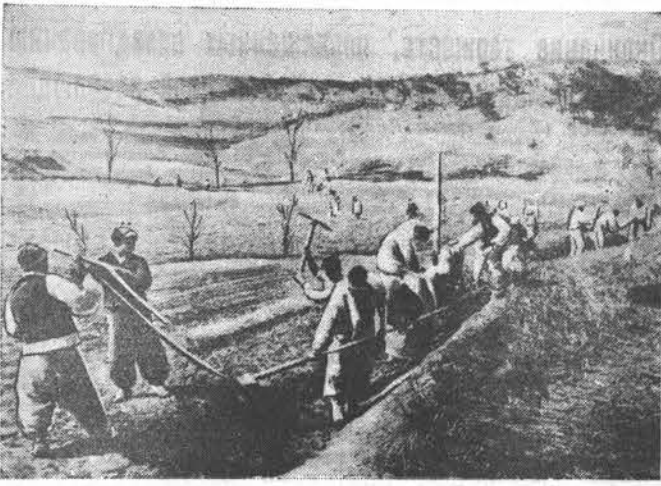
Несмотря на варварские бомбардировки американской авиации городов и сел, трудящиеся Кореи самоотверженно работают, оказывая помощь своей родной армии. Рабочие у станков, крестьяне на поле без устали тратятся ради победы. НА СНИМКЕ: крестьяне одной из деревень очищают оросительный канал.