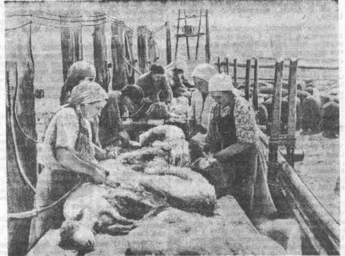
В колхозе «Путь Ильича», Усть-Канского аймака, введена электрическая стрижка овец. Механизация стрижки значительно повышает производительность и качество работ. НА СНИМКЕ: колхозники за стрижкой овец.

Успешно развернула сенокос сельскохозяйственная артель «Победа» (председатель тов. Папан). В заготовке кормов здесь принимает участие большинство трудоспособных колхозников. За один день они скосят травы с площади 13 гектаров. Хорошо организована сенокоска в колхозах «Сталинский путь», имени Суворова и других. Стремится закончить сенокос к началу жатвы, колхозники этих артелей изо дня в день повышают производительность труда. Средняя выработка на каждую сенокосилку здесь составляет 4,5—5 гектаров вместо 3,5 по норме.