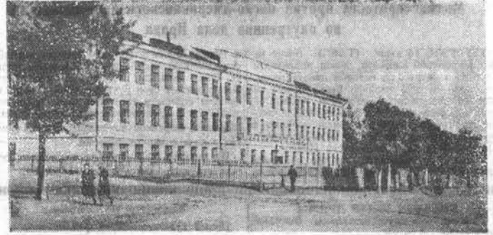
НА СНИМКЕ: школа руководящих колхозных кадров в Барнауле.

щественного добра, укрепляются организация труда и дисциплина, растет производительность, а трудящийся становится полностью свободным. В условиях послевоенной помощи и заботы партии, Советского государства о подеме сельского хозяйства все колхозы края имеют равные возможности для организационного и хозяйственного роста и вполне могут ставить первоочередной задачей достижение уровня таких передовых хозяйств края, как колхоз имени Молотова, Шипуновского района, «Завет Ильича», Алейского района, «Страна Советов», Угловского района, «Советская Сибирь», Алтайского района, и других, с тем, чтобы на примере этих хозяйств поднять культуру земледелия и животноводства, обеспечить значительный рост всех отраслей общественного хозяйства. Но для этого руководителям колхозного производства следует настойчиво овладевать наукой, учиться умно, терпеливо. В нашем крае после решения февральского Пленума ЦК ВКП(б) о создании двухгодичных школ по подготовке руководящих кадров колхозов за период с 1948 года подготовлено 233 техника-организатора колхозного производства, переподготовлено 605 председателей колхозов. Абсолютное большинство из них, работав после окончания школы колхозных кадров на руководящих постах колхозного производства, на деле осуществляют сталинскую программу создания материально-технической базы для дальнейшего подъема артельного хозяйства, повышающего его куль-