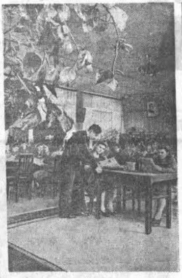
В читальном зале библиотеки Барнаульского металлургического комбината многие текстильщики проводят свой досуг за книгой и журналом. НА СНИМКЕ: читальный зал библиотеки.