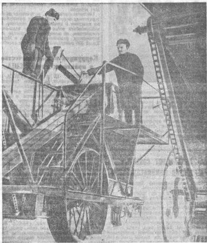
Совхоз «Пролетарий» (Троицкий район) успешно ведёт ремонт тракторов и других сельскохозяйственных машин.