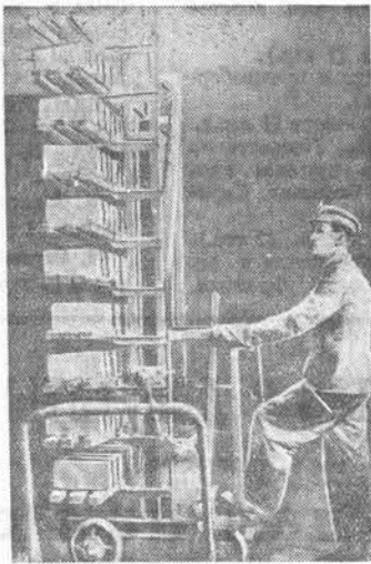
На кирпичном заводе ордена Ленина треста «Стройгаз» отапливается высокая производительность труда...