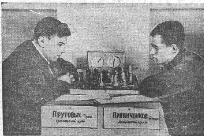
В г. Барнауле проходит шахматно-шашечный турнир колхозников на переносно-республики по сибирской зоне. В нём принимают участие лучшие шахматисты и шашкистов Новосибирской, Кемеровской и Иркутской областей, Алтайского и Красноярского краёв.