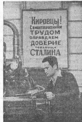
ЛЕНИНГРАД. В Кировском избирательном округе.

Процесс в Праге группы агентов Ватикана и иностранных разведок (4 стр.). Отъезд Плехана в Вашингтон (4 стр.). В Политическом комитете Генеральной Ассамблеи ООН (4 стр.). В Союзническом Совете по Австрии (4 стр.). Газета «Таймс геральд» о связях Трумэна с преступным миром (4 стр.). Агрессивные планы Соединённых Штатов в Японии (4 стр.).