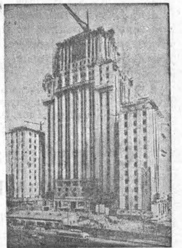
Москва. Строительство высотного здания на Смоленской площади.

Серьёзных успехов добились механизаторы сельского хозяйства республики. На 20-е октября машино-тракторные станции Азербайджана досрочно выполнили годовую план тракторных работ на 102,1 процента, по сравнению с прошлым годом тракторных работ выполнено больше на 460 тысяч гектаров мягкой пахоты.