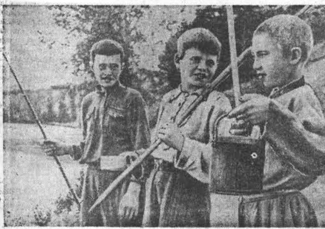
Во время летних каникул.