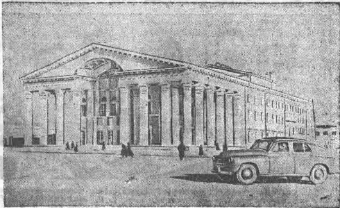
В столице Монгольской Народной республики — Улан-Баторе. Здание музыкально-драматического театра.